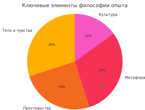
Рис. 1 / Fig. 1. Ключевые элементы философии опыта / Key elements of philosophy of experience